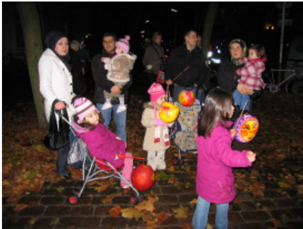
„St. Pauli leuchtet“ 2007

Alle Jahre wieder tun die Gewerbetreibenden St. Paulis Gutes für die Kinder im Stadtteil und organisieren zum Abschluss der Laternensaison den