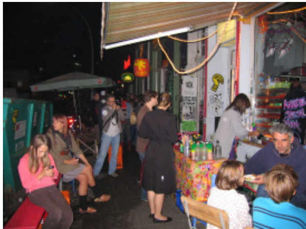
Wohlwillstraße vorm Kandie Shop

tungen ihre Arbeiten präsentierten. Dazu gab es Musik vom Plattenteller und eine Videopräsentation mit Werken der anwesenden Künstler. Aber