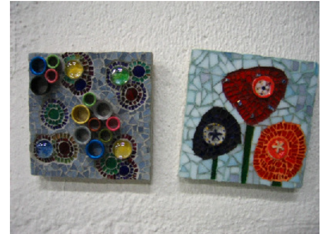
Mosaik von Paola Capelo, Ausstellungshalle

Falls auch Sie am 5. September in der Mitte St. Paulis unterwegs waren, schreiben Sie uns Ihre