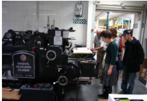
Druckerei in St. Pauli, Große Freiheit

auch an den etwas abgelegenen Standorten wie etwa beim Gemeinschaftsatelier Textur & Atelier Lux in der Kleinen Freiheit 42-44 oder bei Möbelheim in der Simon-von-Utrecht-Straße 80 war man hoch zufrieden, da das kunstinteressierte Publikum gezielt auch diese Locations ansteuerte. Die Stimmung war großartig und das abwechslungsreiche Programm, das sich die Kreativen für diese Nacht ausgedacht hatten, trug maßgeblich dazu bei, dass sich immer wieder Menschengruppen bildeten wie zum Beispiel vorm Kandie Shop und Kaffee Stark in der Wohlstraße oder auch