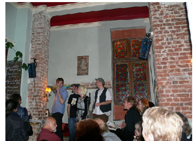
Poetry Slam im Kaffee Stark, Wohlwillstraße

Eindrücke zur Kreativnacht per Email an st.pauli@steg-hamburg.de , damit wir Ihre Anregungen aufnehmen und die Kreativnacht beim 2. Mal noch besser machen können.