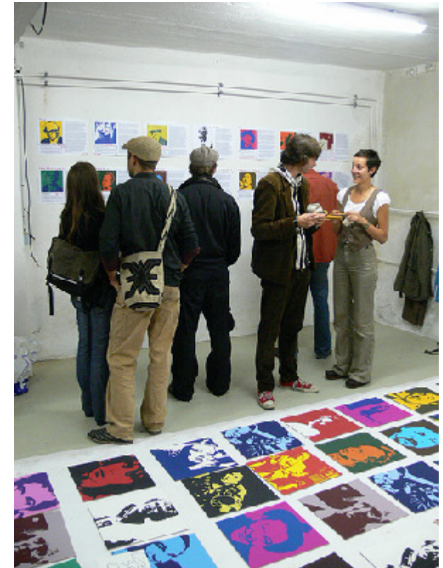
Leitkultur Memory, Ausstellungshalle

Bechler von Midori in der Paul-Roosen-Straße. Als am 5. September um 18 Uhr in der Ausstellungshalle Clemens-Schultz-Straße noch die letzten Nägel in die Wand geschlagen wurden, strömten bereits die ersten Besucher herein. Ausgerüstet mit Programmheften, ging es von einem Standort zum nächsten, wobei am Ende des Abends allein in der Ausstellungshalle über 2.000 Besucher gezählt wurden. Die Halle war zweifelsohne einer der Highlights der Kreativnacht, da dort 15 Künstler unterschiedlichster Kunstrich-